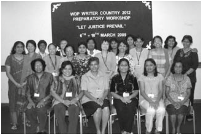
Das malaysische WGT-Komitee

Menschenrechte sind unteilbar: Wird ein Recht verletzt, hat das Auswirkungen auf die Verwirklichung der anderen Rechte. Mädchen können zum Beispiel ihr Recht auf Bildung in vielen Fällen nicht wahrnehmen. Infolgedessen haben sie keine Chancen auf dem formellen Arbeitsmarkt. Das wiederum verletzt ihr Recht auf Arbeit und eigenes Einkommen. Außerdem darf kein Mensch in der Verwirklichung seiner Rechte aufgrund von Nationalität, Geschlecht, ethnischer Herkunft, Hautfarbe, Religion oder Sprache diskriminiert werden. Die „Konvention zur Beseitigung jeder Form von Diskriminierung der Frau“ (CEDAW) wurde 1979 von der Generalversammlung der Vereinten Nationen verkündet und trat 1981 in Kraft. Die Konvention verpflichtet alle Vertragsstaaten, die Diskriminierung von Frauen zu verbieten und ihnen Zugang